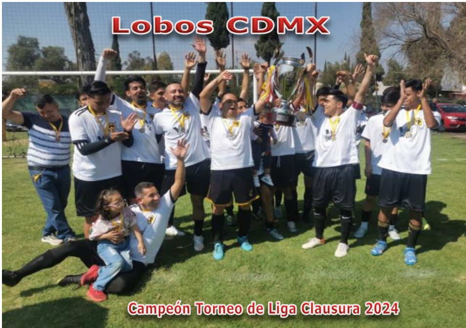
Campeón Torneo de Liga Clausura 2024

Obligación de presentar 2 Balones en condiciones reglamentarias