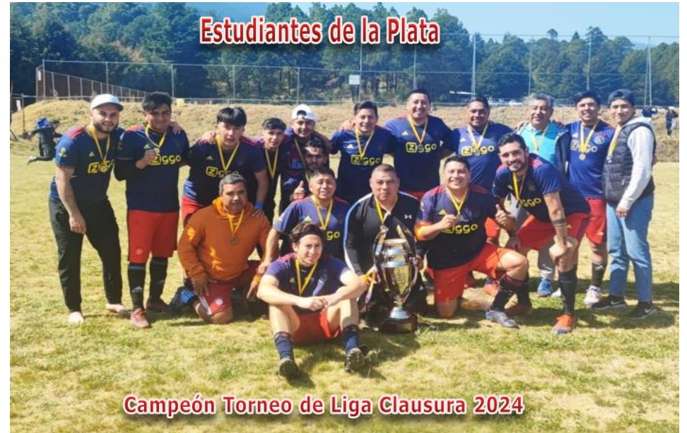
Estudiantes de la Plata