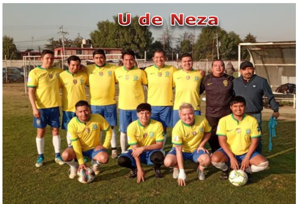
U de Neza