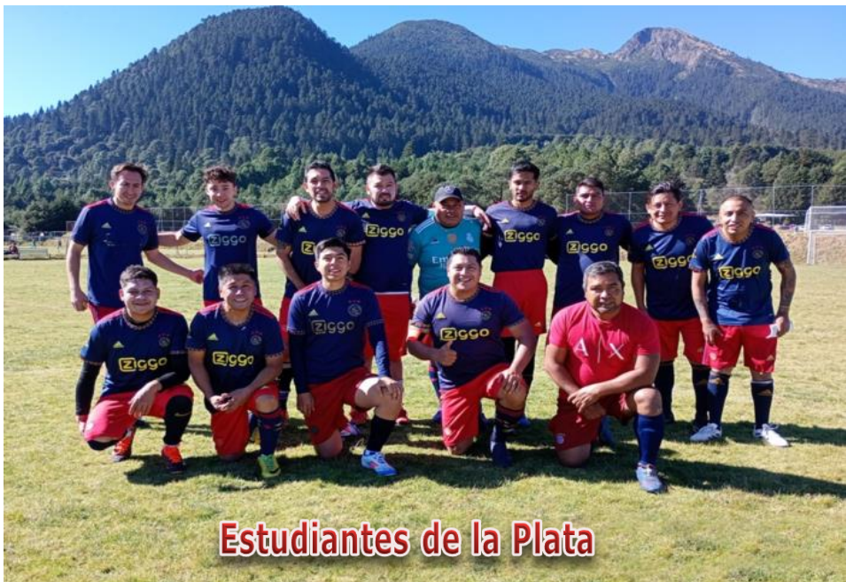
Estudiantes de la Plata

Obligación de presentar 2 Balones en condiciones reglamentarias