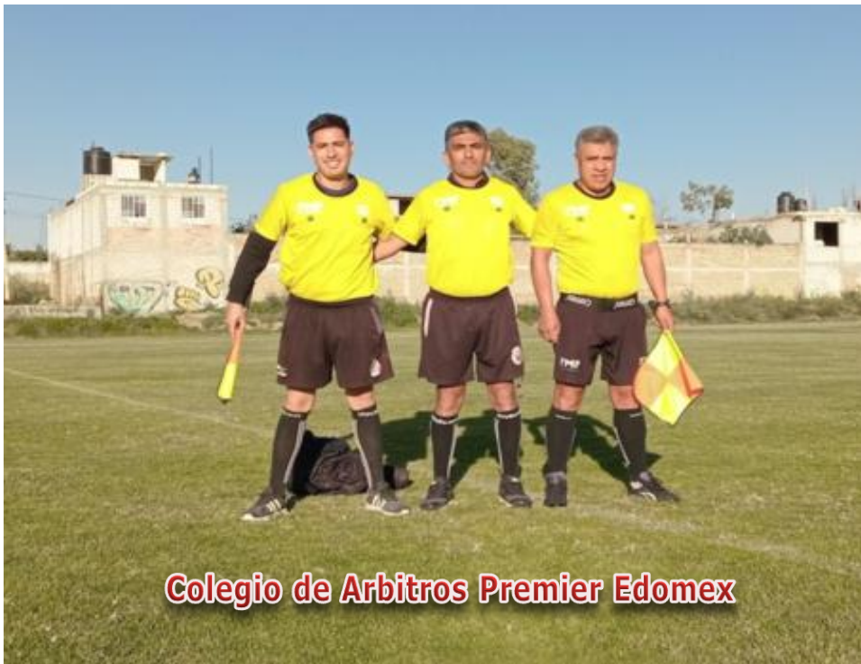
Colegio de Arbitros Premier Edomex