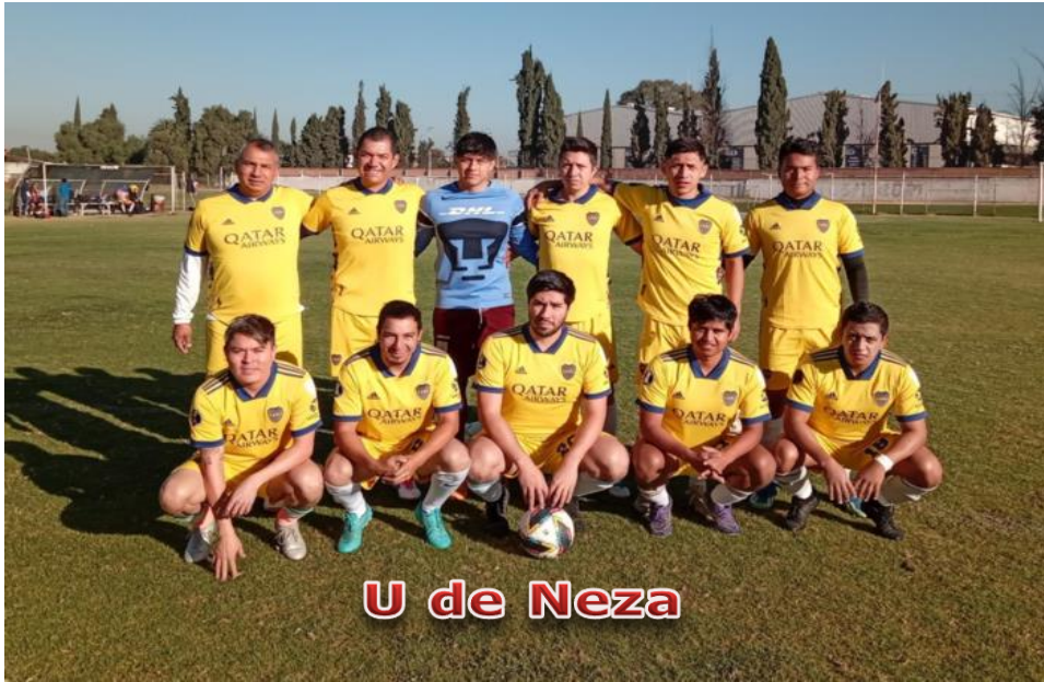
U de Neza

Obligación de presentar 2 Balones en condiciones reglamentarias