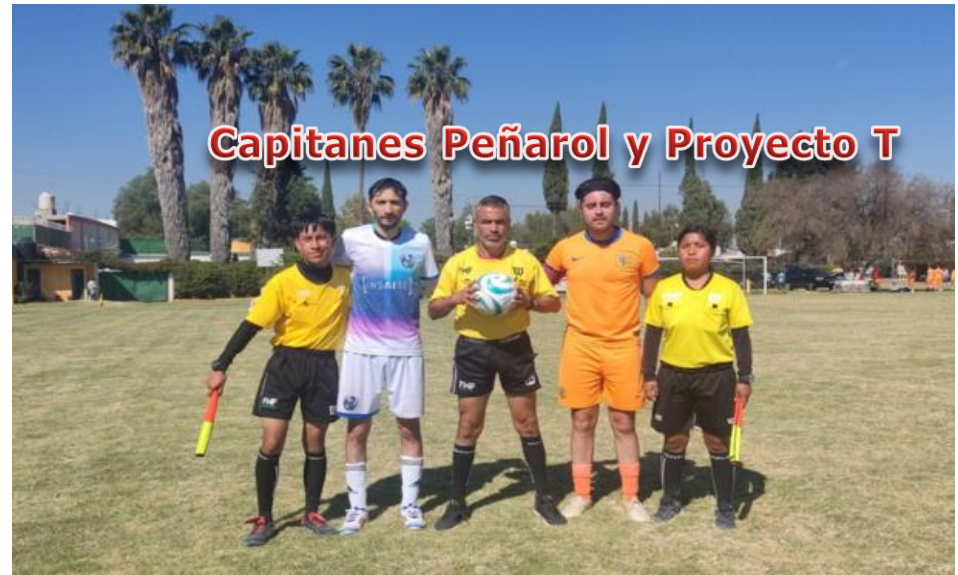
Capitanes Peñarol y Proyecto T

Lean las Notas publicadas en los Boletines