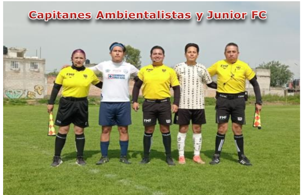
Capitanes Ambientalistas y Junior FC

Lean las Notas publicadas en los Boletines