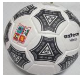
Con 3 capas $250