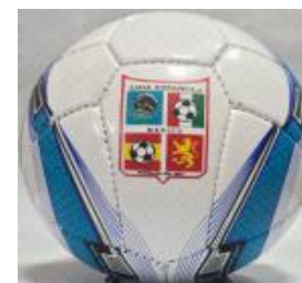
Con 3 capas $250