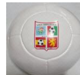
Con 2 capas $160

Visite la página de Internet de la Liga: www.ligaes.com