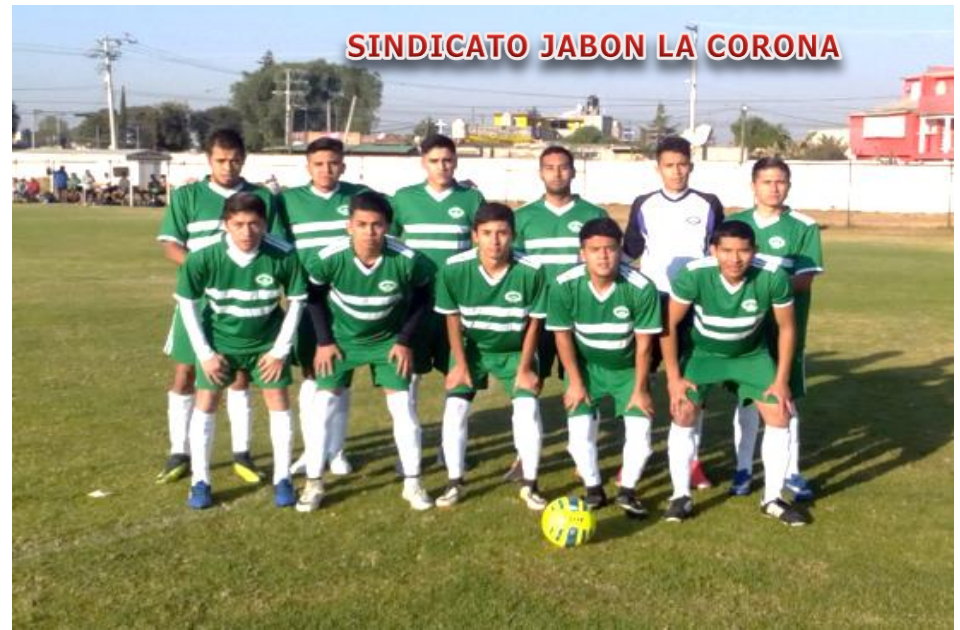
SINDICATO JABON LA CORONA