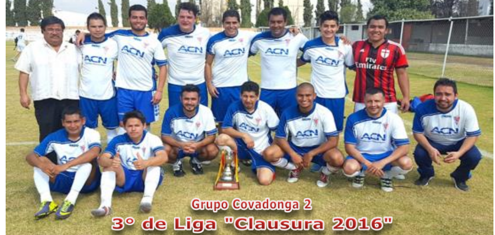
Grupo Covadonga 2 3º de Liga "Clausura 2016"