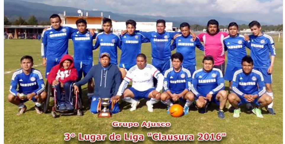
Grupo Ajusco 3º Lugar de Liga "Clausura 2016"