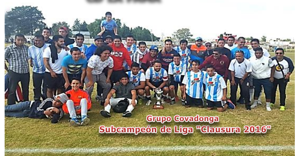
Grupo Covadonga Subcampeón de Liga "Clausura 2016"