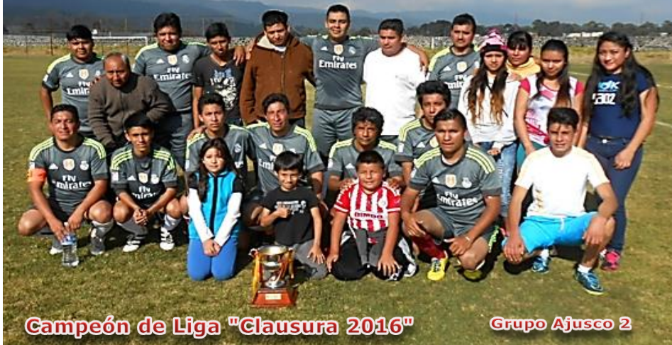
Campeón de Liga "Clausura 2016"