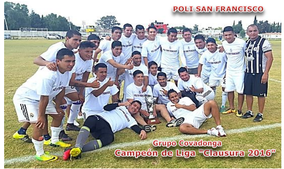
POLI SAN FRANCISCO