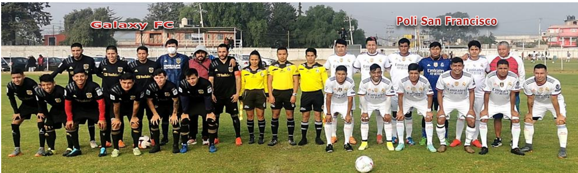
Poli San Francisco