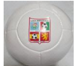
Con 2 capas $160