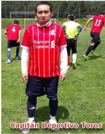
Capitán Deportivo Toros