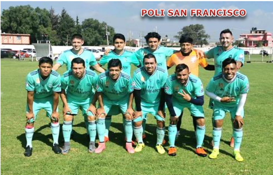
POLI SAN FRANCISCO