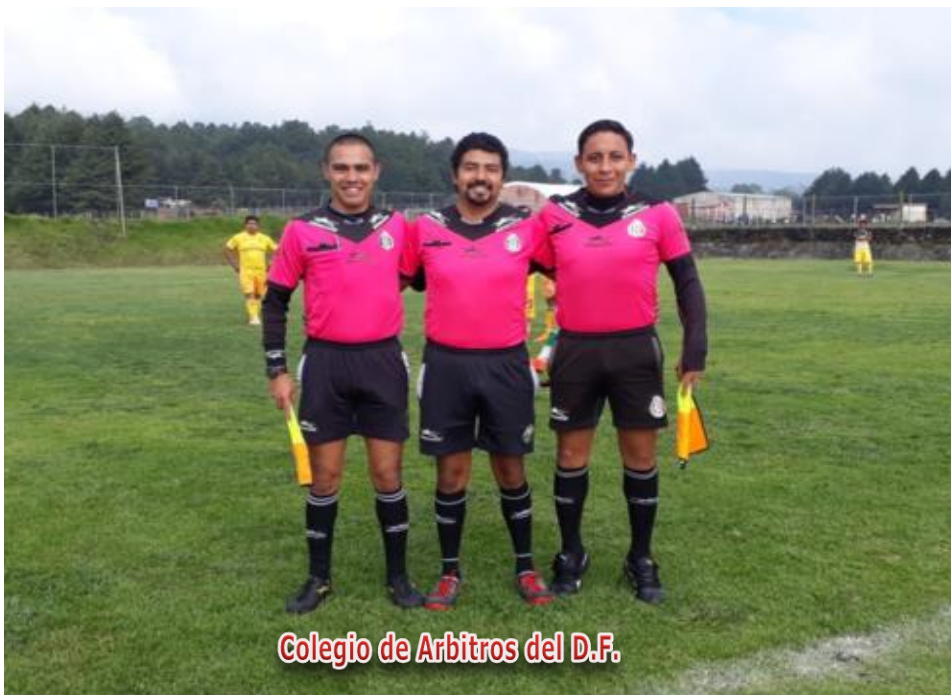
Colegio de Arbitros del D.F.