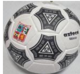
Con 3 capas $250

VENTA BALONES. Información en las oficinas de la Liga