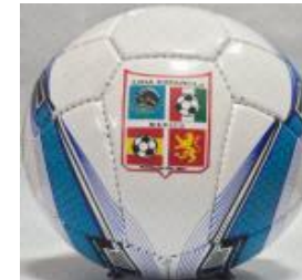
Con 3 capas $250