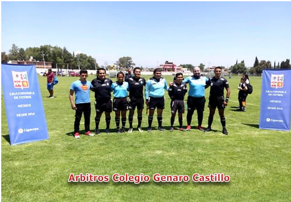
Arbitros Colegio Genaro Castillo