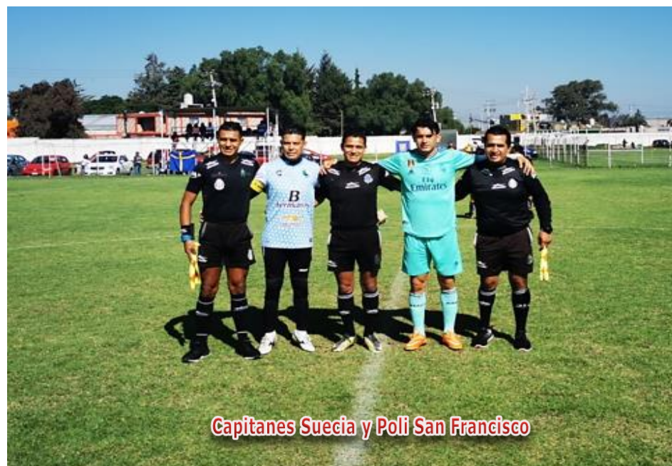
Capitanes Suecia y Poli San Francisco

En todas las eliminatorias, en caso de empate, Penaltys