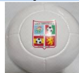
Con 2 capas $160