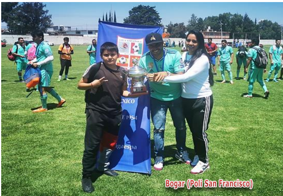
Bogar (Poli San Francisco)