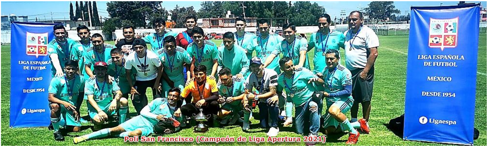
Poli San Francisco (Campeón de Liga Apertura 2021)