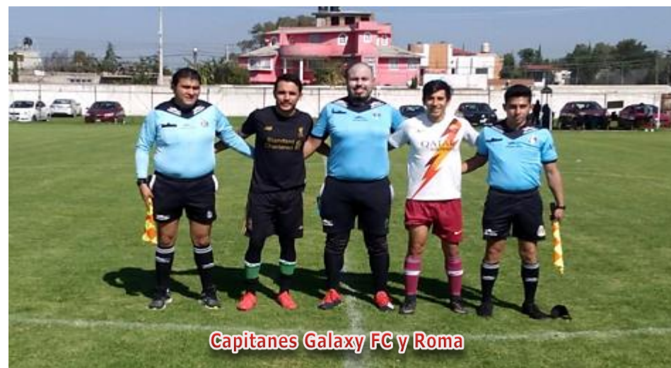
Capitanes Galaxy FC y Roma