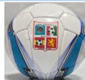
Con 3 capas $250