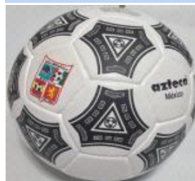
Con 3 capas $250