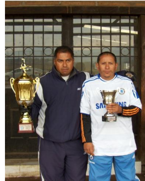
Equipo Chelsea con sus Trofeos