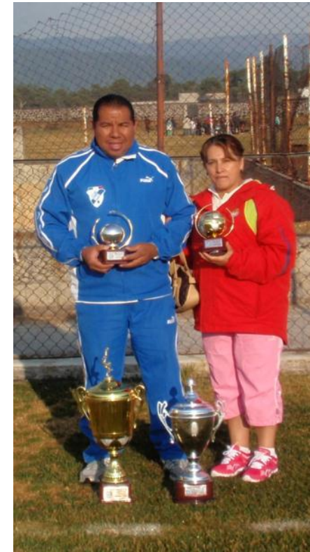
Integrantes del Equipo Merced Gómez con sus Trofeos