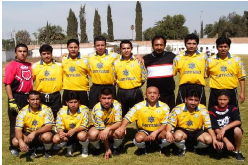
U DE NEZA 2006

Las sanciones aplicadas a los Equipos deben de estar cubiertas en el transcurso de la semana. De esta forma serán tomados en cuenta para la aplicación del 1/2 punto.