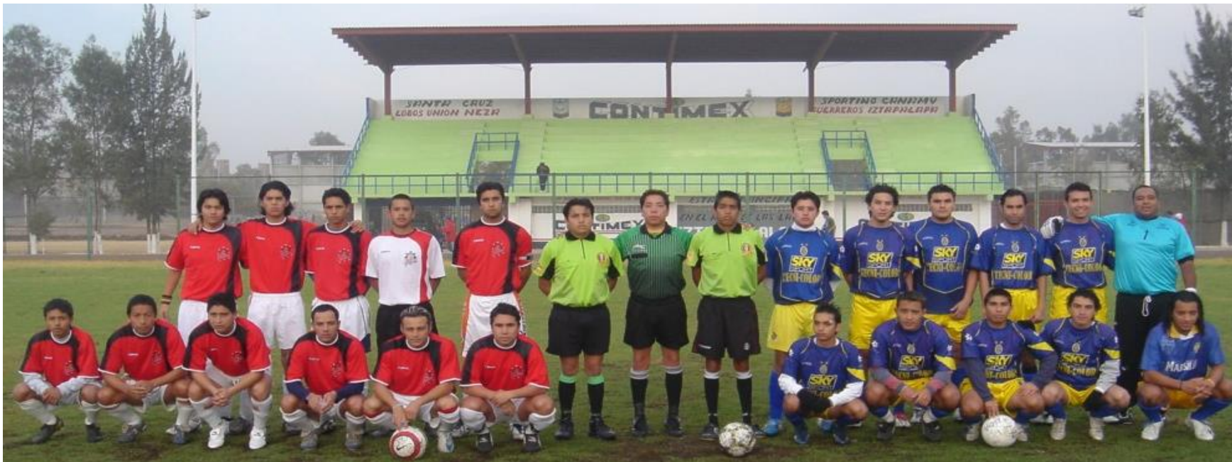
Partido Inaugural del Torneo de Liga "Apertura 2006"